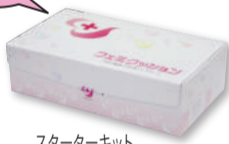
スターターキット